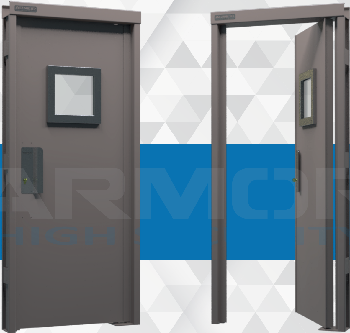
PUERTA BLINDADA CON MIRILLA